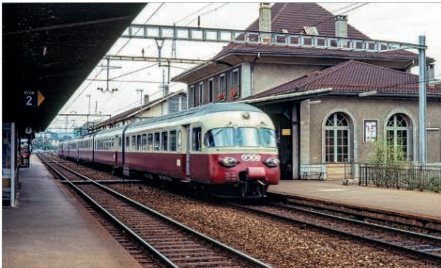
1981. TransEuropExpress. (Jean Vernet)