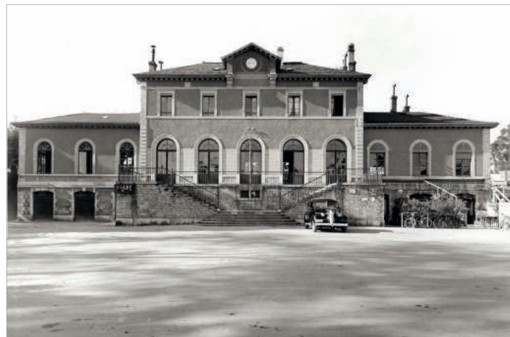
1948. Bâtiment aux voyageurs.

En souscription jusqu'au 30 octobre 2022 (voir au dos)